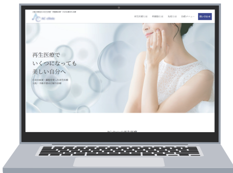
パソコンイメージ例